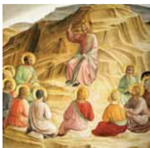
Il regno dei cieli è simile a una rete gettata nel mare.